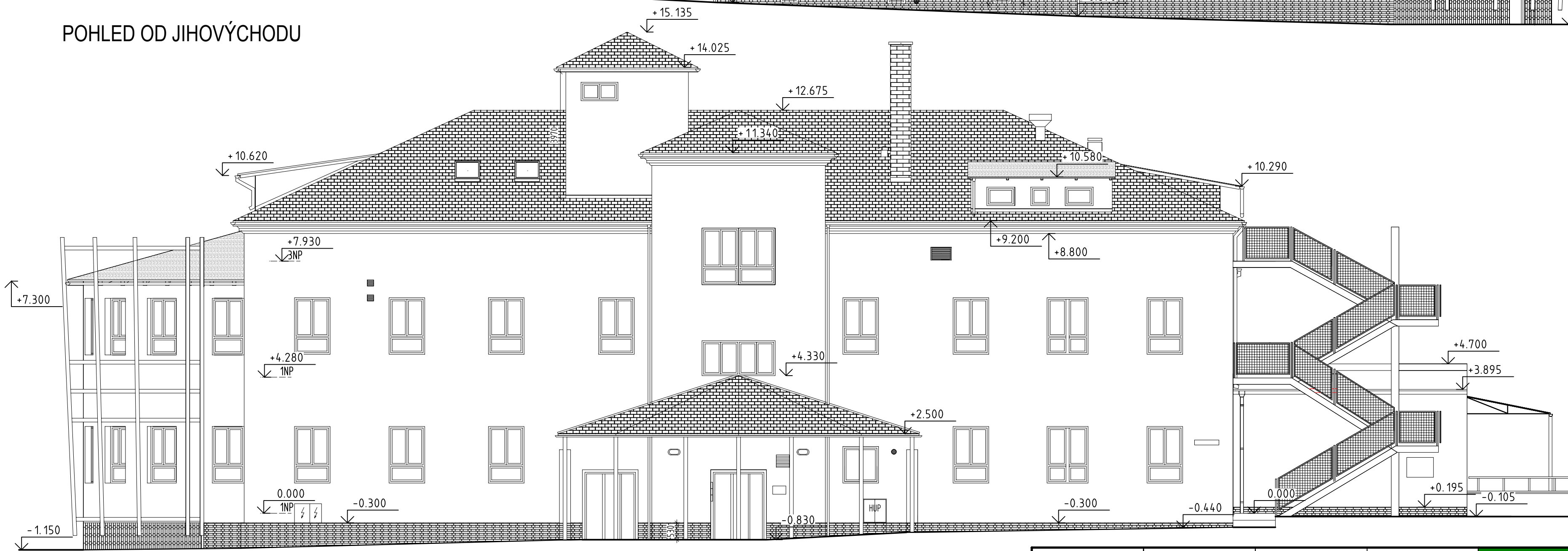
POHLED OD JIHOVÝCHODU